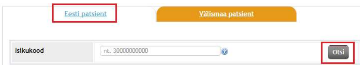
Joonis 8 - Eesti patsiendi otsimine

Juhul, kui tegemist on inimesega, kes omab ravikindlustust mõnes Euroopa Liidu liikmesriigis, tuleb esmalt valida vaheleht „Välismaa patsient“ ning soodustingimustel ravimite välja kirjutamiseks sisestada Euroopa ravikindlustust tõendava dokumendi andmed. NB! Tuleb arvestada, et sama kehtib ka Eesti kodaniku puhul, kes omab teises Euroopa Liidu liikmesriigis kindlustatust. Sel juhul tuleb isikukoodina märkida isikukood, mis on fikseeritud ravikindlustust tõendaval dokumendil. EL kindlustatule retsepti koostades tuleb digiretseptile (kindlustust tõendavalt dokumendilt) sisestada järgnevad andmed: Ees- ja perekonnanimi, välisriigi isikukood, kindlustajariik, sugu, sünniaeg ja andmed kindlustust tõendava dokumendi kohta ( liik, kehtivus, väljastamise kuupäev, pädeva asutuse kood, ERK kaardi puhul kaardi number ; vt Joonis 9).