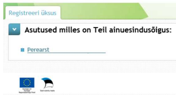
Joonis 1 - Asutuse registreerimine

Esmakordsel sisenemisel on vaja valida soovitud portaal (st TTO või apteegiportaal). Edaspidi jätab keskkond selle valiku vaikimisi meelde ning järgmine kord seda enam eraldi valida ei pea. Rolli valik toimub rakenduse üleval paremas nurgas asuva portaali valiku all asuva rippmenüü abil. Asutuse registreerimiseks valige rolliks „registreerija“ ning nimekirjast asutus, mida soovite registreerida ja vajutage selle nimele (vt Joonis 1).