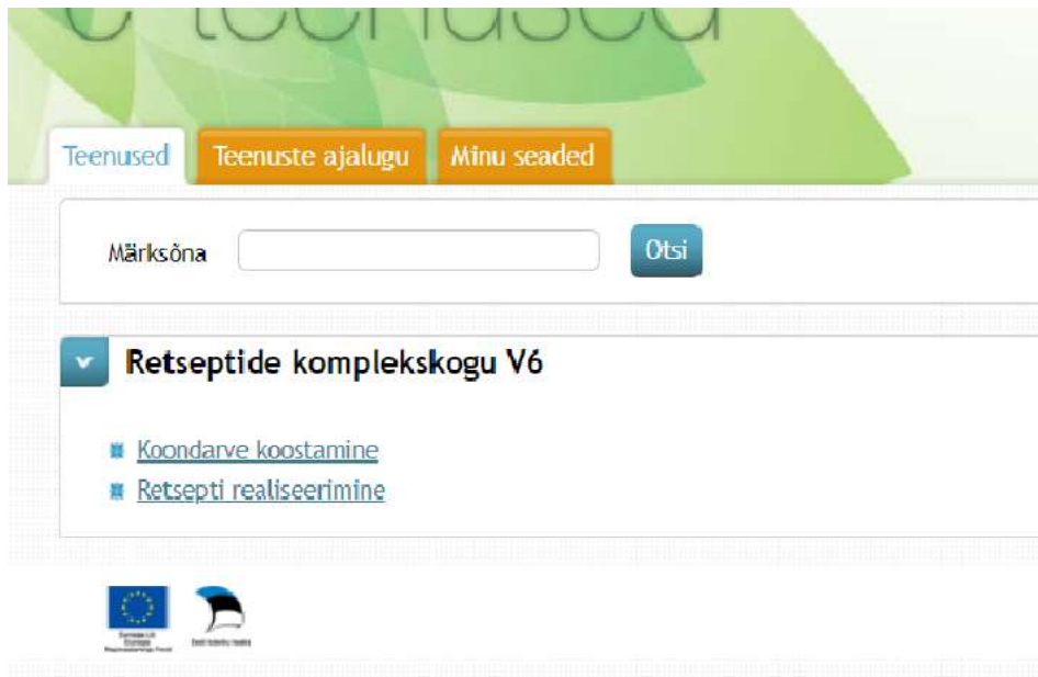
Joonis 7.1 – Teenused meditsiiniseadmete müüjatele

Meditsiiniseadmete müüjatele on avatud teenused retsepti realiseerimiseks ning koondarve koostamiseks (vt Joonis 7.1).