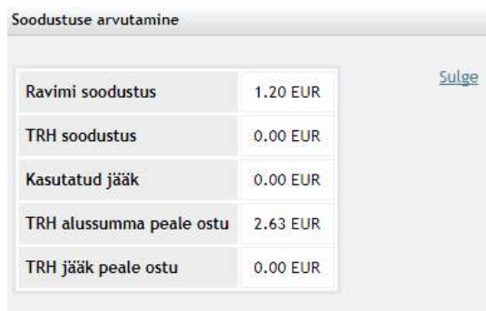
Joonis 23 - Soodustuse arvutamine

Nähtavale ilmunud aknas on võimalik sisestada müügiandmeid, st pakendite arvu, ühe pakendi hinda, soodustatud summat (haigekassa osa retsepti maksumuses), ostja isikukoodi ning vajadusel lisada apteekri selgitust või muuta süsteemi poolt etteantud soodusmäära. Kui pakendite arv ei ole täisarv (sh MS pakendid), siis tuleb sisestada pakendi kogus kolm kohta peale koma. Soodustatud summa korrektsuse koheseks kontrolliks ning isikule võimaldatud täiendava ravimihüvitise nägemiseks tuleb vajutada nupule „Soodustuse arvutamine“. Viimase tulemusel saadakse järgnev info: ravimi soodustus (haigekassa poolt kompenseeritud summa), TRH soodustus, kasutatud jääk, TRH alussumma peale ostu, TRH jääk peale ostu (vt Joonis 23). Juhul, kui esialgselt sisestatud soodustatud summa oli vale, muudab süsteem automaatselt summa õigeks.